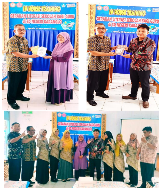
Gambar 3. Penyerahan Simbolis Hibah Buku dan Foto Bersama

cerpen, dan buku referensi umum. Kegiatan ditutup dengan foto bersama pemateri dan peserta kegiatan pengabdian kepada masyarakat ini.